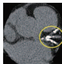
※低被ばくソフトを採用